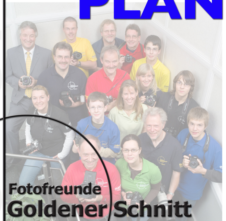
Fotofreunde Goldener Schnitt Künzell e.V.